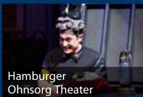
Hamburger Ohnsorg Theater