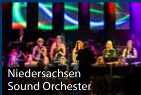
Niedersachsen Sound Orchester